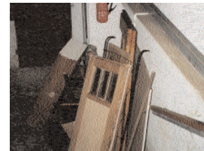
Fatal im Brandfall: abgestellter Sperrmüll in Fluchtwegen.

Bei einem Brand müssen die Rettung von Mensch und Tier sowie wirksame Löscharbeiten gewährleistet sein (BayBO §15).