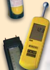
Feuchtemessgeräte für Oberflächen- und Materialfeuchte (Putz)