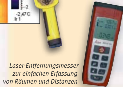
Laser-Entfernungsmesser zur einfachen Erfassung von Räumen und Distanzen