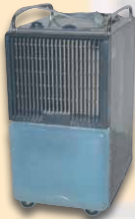
Bautrockner zur Entfeuchtung bei Wasserschäden und Kellern