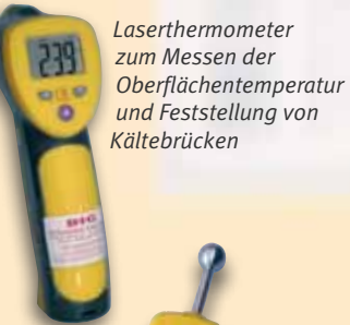
Laserthermometer zum Messen der Oberflächentemperatur und Feststellung von Kältebrücken