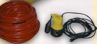
mobile Tauchpumpe als Ersatz für defekte Hebepumpen