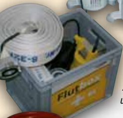
Flutbox mit Hochleistungspumpe und C-Rohr-Anschluss zum Auspumpen von Kellern und Garagen