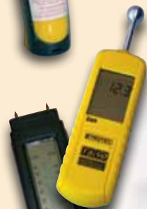
Feuchtemessgeräte für Oberflächen- und Materialfeuchte (Putz)