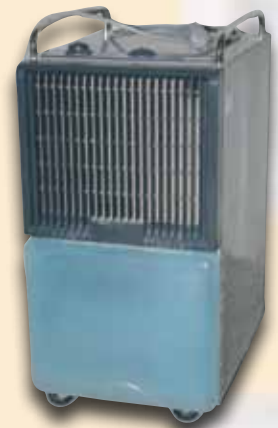
Bautrockner zur Entfeuchtung bei Wasserschäden und Kellern