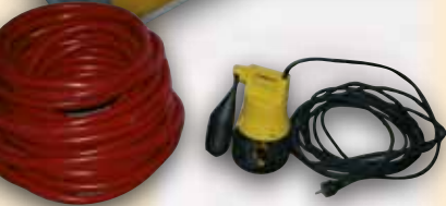
mobile Tauchpumpe als Ersatz für defekte Hebepumpen